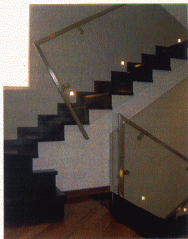
PARAPETTO ACCIAIO INOX E CRISTALLO