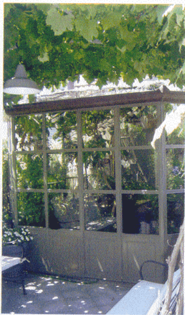
VERANDA IN FERRO CON DECORI