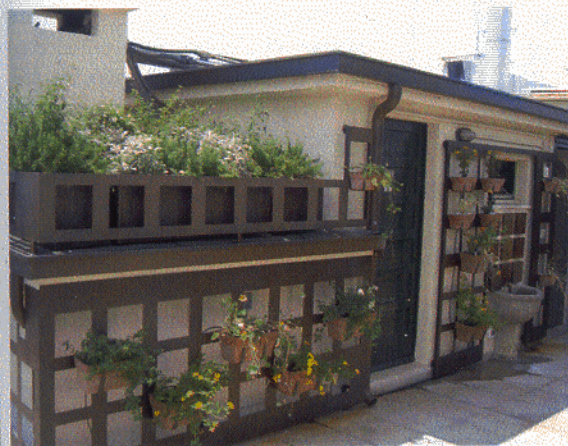
TRELLAGE IN CORTEN

Nascono così mobili, scale, cancelli, parapetti e ringhiere, letti, ma anche gazebo, verande, lampade, e tavoli